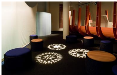
Los viajes de Colón