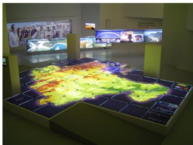
Navarra, un futuro entre todos