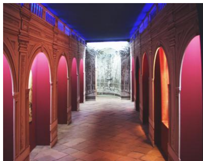
Museo Histórico de Aranjuez