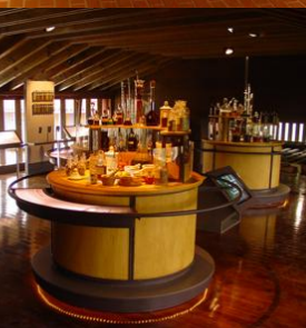
Jardín Botánico Atlántico de Gijón